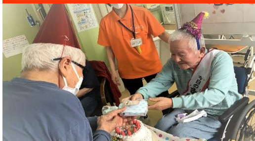
利用者様のお誕生日には、誕生日会を開催します。皆さんでお祝！！