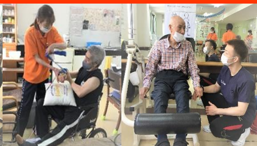
体の状態に合わせた個別機能訓練 日常生活で困ったことを相談下さい。