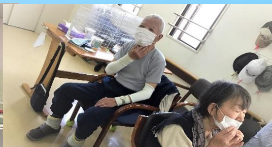
食事前には、口腔体操。手指消毒の徹底。