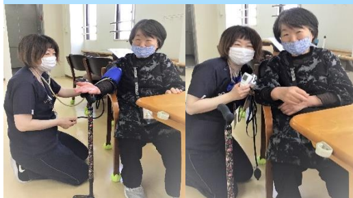
おはようございます。体調は如何でしょうか？ 来所後の健康チェック。