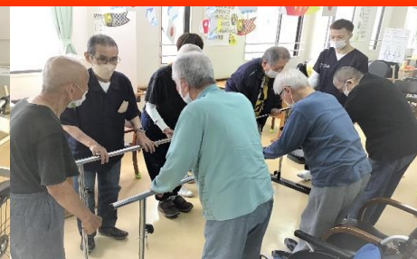
同じ目的を持った人が集まるから頑張れる。皆で楽しくリハビリ体操。