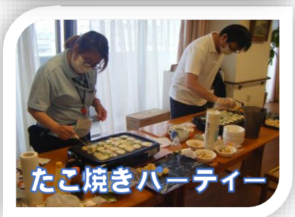
たこ焼きパーティー